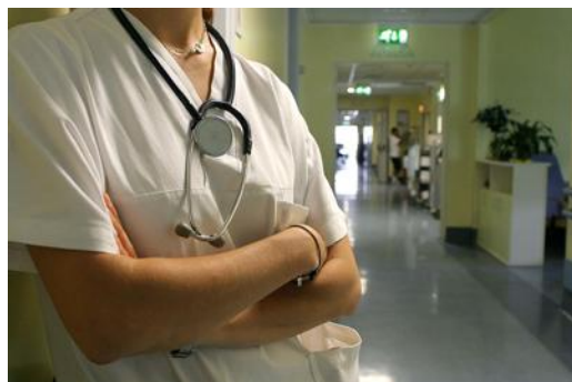
Immagine di repertorio (Fotogramma)